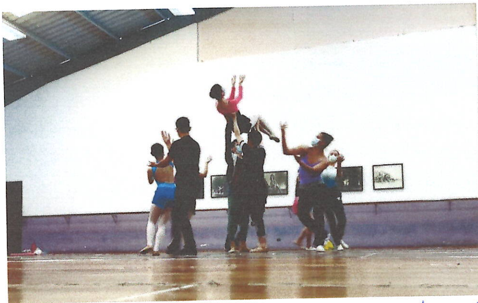
Ensayo para el perfeccionamiento de los pasos