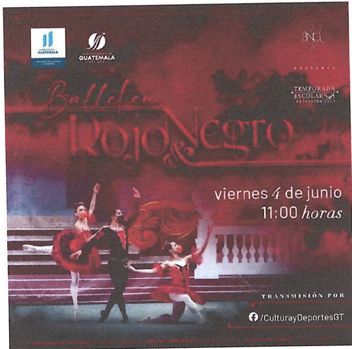
Presentación Artística del Ballet en Rojo y Negro