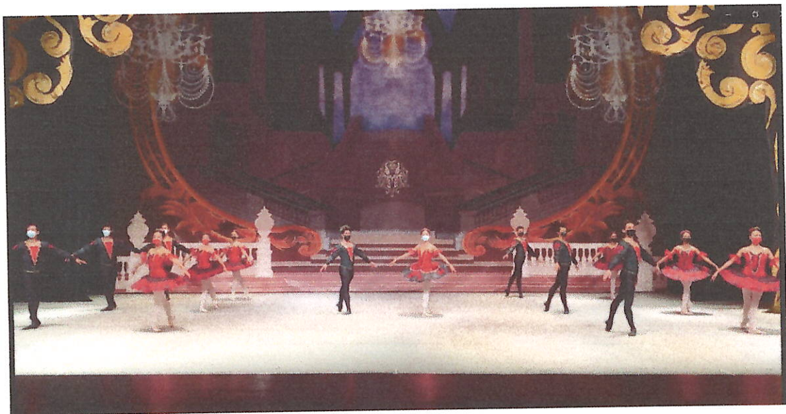
Presentación Artística en la Gran Sala Efraín Recinos de la obra "Ballet en Rojo y Negro"