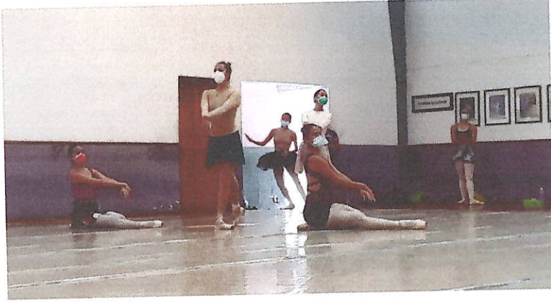
Ensayo de las nuevas obras a presentar